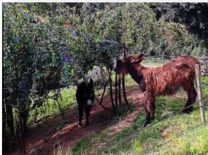
Unsere Esel lieben frische Pflaumen, sonnenwarm vom Baum

Wir durften lernen, dass Allwetterabdeckungen für Heu zwar auf dem Heu liegen können, aber nicht grundsätzlich ihre Aufgabe erfüllen, geschweige denn ihrem Namen gerecht werden. Wir haben auch gelernt, dass Esel sich nur sehr selten überfressen oder sich Futter hingeben dass ihnen nicht gut tut.