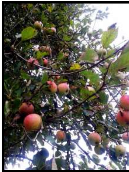
Einer unserer alten Apfelbäume in voller Frucht

Neben dem Sortennamen, der Verwendung und Lagerung sind auch Herkunft und Pflege Teil der begonnenen Informationssammlung.