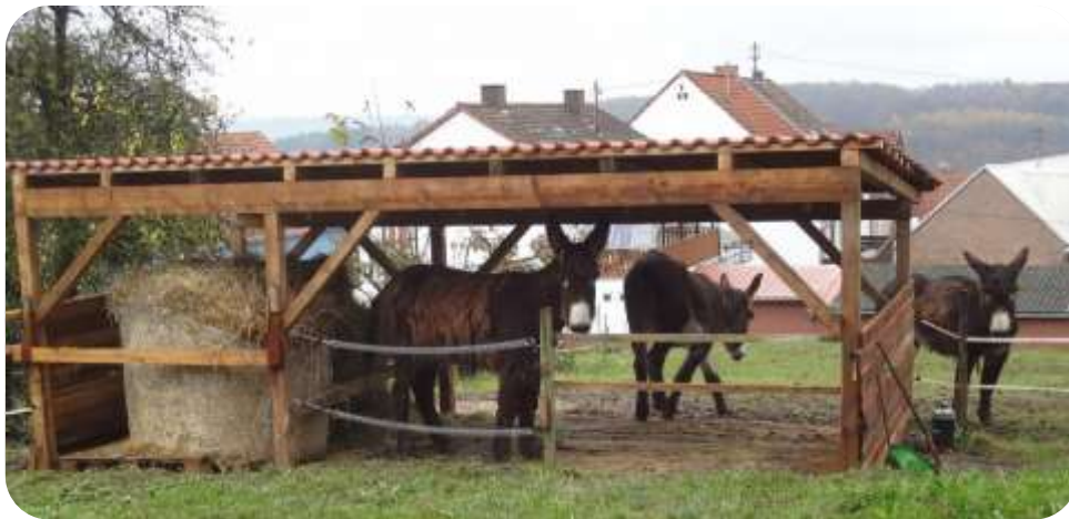
Der neue Eselunterstand – mit schickem Ziegeldach

Für den Sommer hatten wir eine alternative, nicht bauamtsrelevante Unterbringung in einem sehr großen Mittelalterzelt eingerichtet. Unser neuer Eselunterstand ist dann im November endlich fertiggestellt worden. Die Esel haben damit eine Unterbringung in der sie vor der Witterung geschützt sind und das Bauamt hat uns die vorab eingereichten Pläne schriftlich als nicht bauantragspflichtig bestätigt.