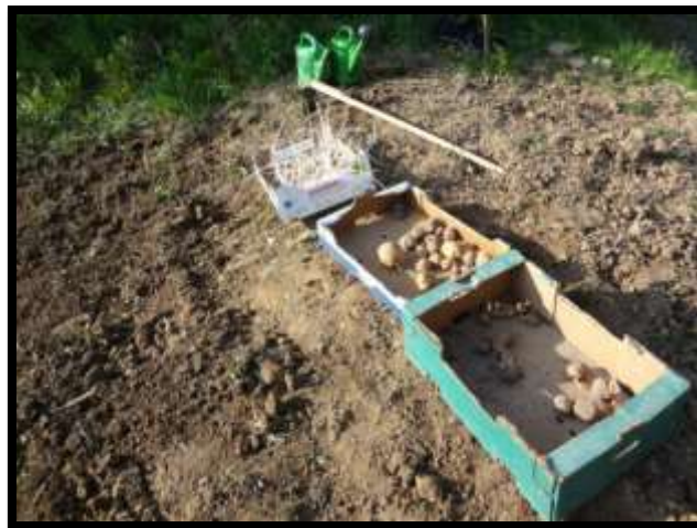
Kartoffeln vorm Aussetzen

Die alten Sorten blühten bis kurz vor der Ernte im Oktober. Das Kraut der handelsüblichen Kartoffeln ist leider schon sehr früh gewelkt und abgestorben. Bei der Ernte am 25.8.2014 konnten wir nur noch 5,471kg Ernten, dies entspricht 91g pro Pflanze. Die alten Sorten brachten am 2.10.2014 gesamt 5,028kg entspricht 168g pro Pflanze. Allgemein war das Jahr auch bei den benachbarten Vollerwerbslandwirten ein schlechtes Kartoffeljahr.