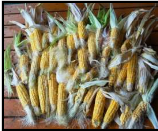
Unsere frischen Maiskolben

Für die Aussaat 2015 wurden von jeder Maispflanze 5-10 Körner in 5 luftdichte Glasbehälter gegeben und in einem Karton gelagert. Laut Fachliteratur sind 100 bis 150 Maispflanzen als Grundstock notwendig um die Fruchtbarkeit der Pflanzen beizubehalten und aus ihnen die Folgesaat zu ziehen. Aus diesem Grund werden auch 2015 noch Saatkörner dazugekauft.